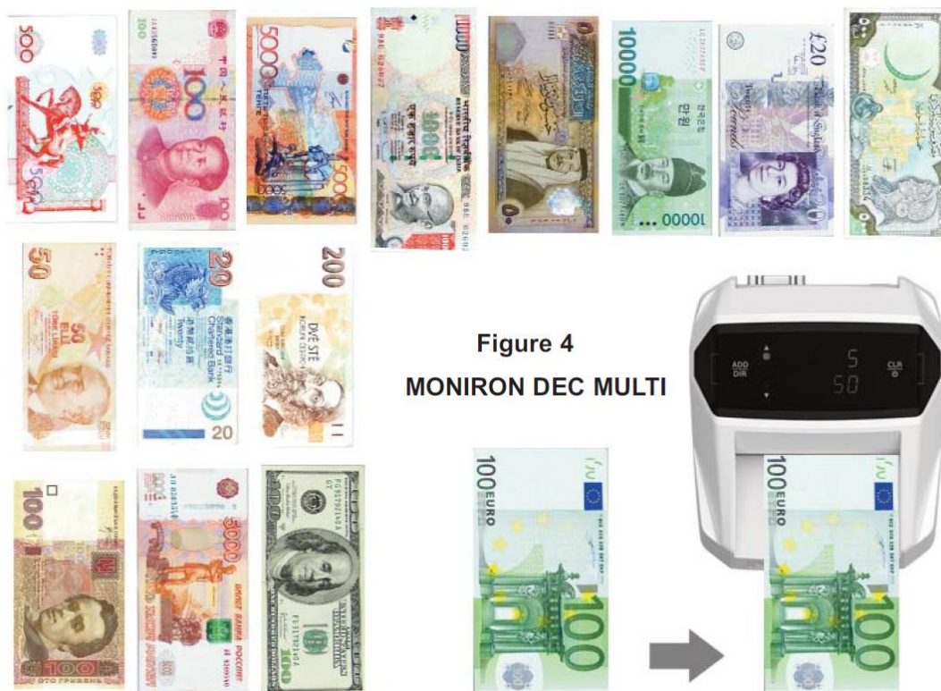
Figure 4 MONIRON DEC MULTI